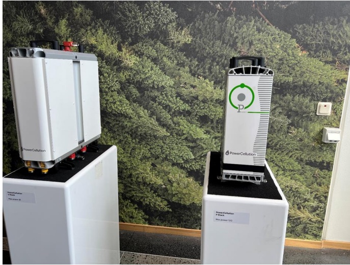
Några av Powercells Stack lösningar