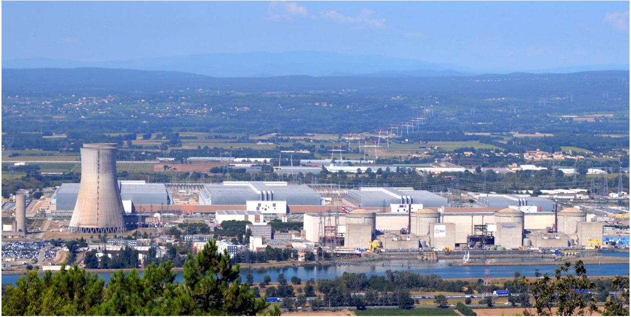
Kärnkraftverken i Tricastin.