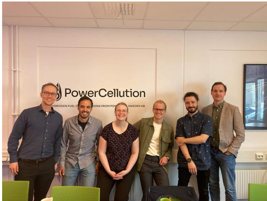
YG framtidsgrupp efter ha lyssnat PowerCells Presentation om företaget.

Powercell har olika partnerskap inom olika sektorer, bland annat har en stor partnerskap med företaget Bosch. Intressanta applikationer som nämndes var inom gruvfordon, skepp och även flygplan. Vi fick även möjlighet att se PowerCells laboratorium som ligger i samma byggnad som huvudkontoret.